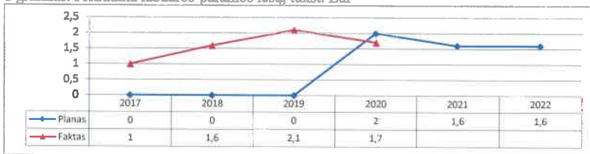
1 grafikas. Pritraukta labdaros-paramos lėšų, tūkst. Eur

Tokie rezultato vertinimo kriterijai nebuvo planuojami iki 2019 m. įskaitytinai, todėl grafike prie 2017 m., 2018 m., 2019 m. plano yra surašyti nuliai, o prie fakto įrašyta, kiek realiai buvo pritraukta labdaros-paramos lėšų. 2020 metais lėšų pritraukta mažiau, nes buvo sumažintas surenkamų lėšų procentas nuo 2 proc. iki 1,2 proc. nuo gyventojų pajamų mokesčio.